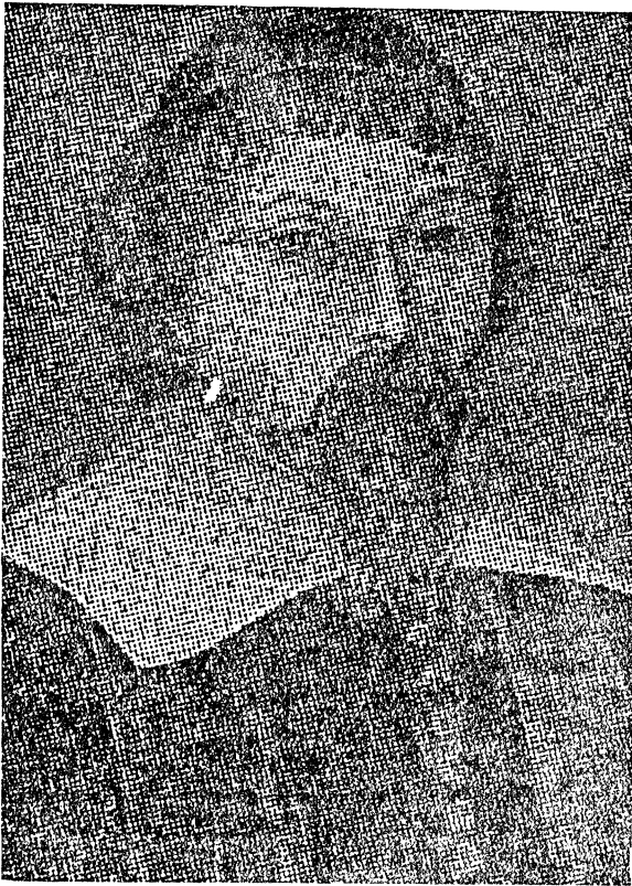
רבי מנשה בן ישראל

זיי וועלען ארויסקומען פאר דער וועלט און מען וועט מיינען אז די ערד האָט זיי ערשט געבוירען. איצט וועלען זיי נאָר שיקען איין שלית. און פראַנצישקא וועט איהם א ביסעל דער-